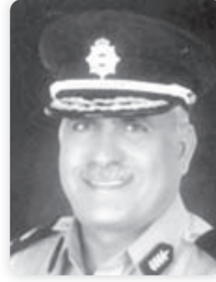
اللواء ابراهيم الرشيد

تكلفتها المالية 12 مليون دولار وتتغلغل إلى أدق الأشياء حتى لو كانت أسلحة